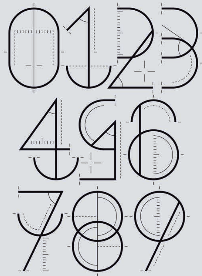
+ Números diseñados para la sección Numerografía de la revista Yorokobu.

+ ¿Cómo es el proceso de creación de una tipografía? ¿Cuánto tiempo puedes tardar en terminarla?