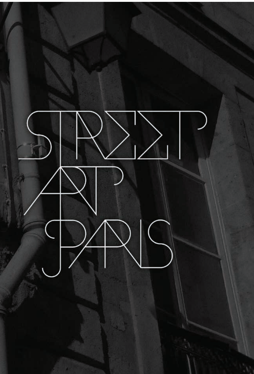
+ Logotipo para blog de graffiti y street art www.streetartlondon.org .

cedidos de una necesidad, casi siempre personal, de crear una tipo que me apetece, o con la que me siento identificado. En el caso de "Favela", fue algo sencillo: tenía ganas de diseñar una fuente relacionada con el graffiti, y siempre me fascinaron los "pixações" (estilo de letra originario de los graffitis de San Pablo). A su vez, siempre me han gustado las construcciones geométricas, y decidí mezclar ambos conceptos para crear esta fuente.